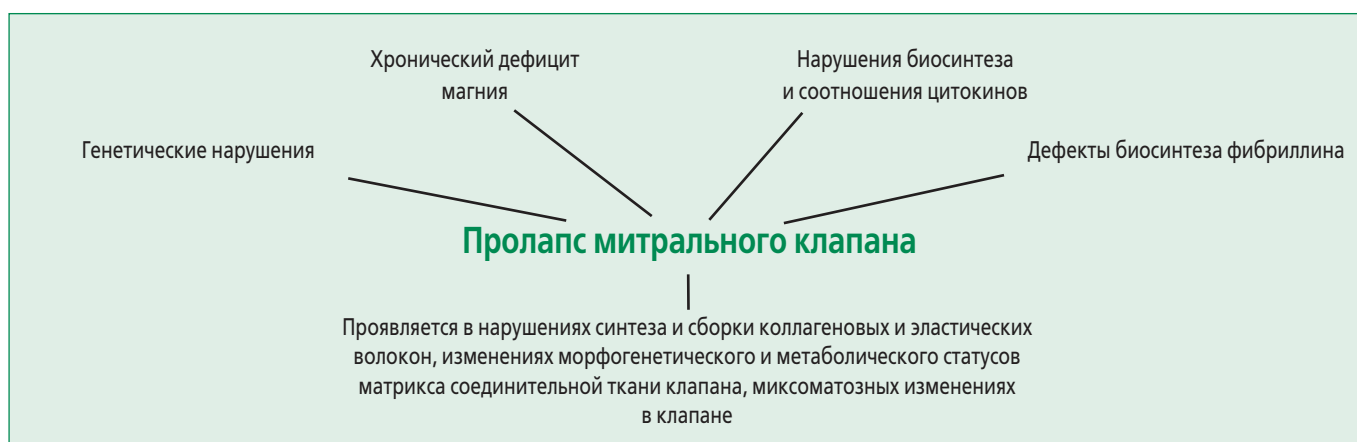
Рисунок 1. Возможные причины развития пролапса митрального клапана

Высокая распространенность пролапса МК в подростковом и молодом возрасте, тяжесть возможных осложнений привлекают пристальное внимание к проблеме не только своевременной диагностики, но и адекватного лечения ПМК, которое должно включать как воздействие на соединительную ткань в целом, так и на дис-