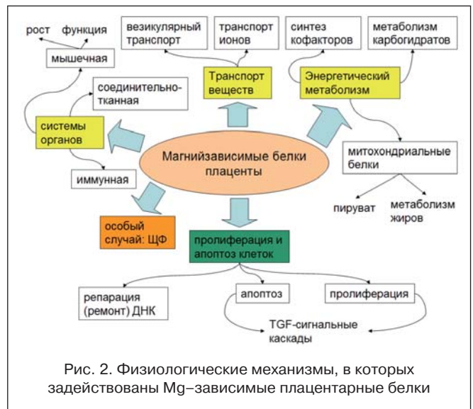
Рис. 2. Физиологические механизмы, в которых задействованы Mg–зависимые плацентарные белки

Магний и белки иммунной системы. Уровни магния влияют на специфический и неспецифический иммунный ответ [16]. Не менее 20 Mg–зависимых плацентарных белков непосредственно задействованы в функционировании сигнальных путей в иммунной системе –