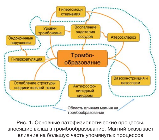
Рис. 1. Основные патофизиологические процессы, вносящие вклад в тромбообразование. Магний оказывает влияние на большую часть упомянутых процессов

В частности, фундаментальные исследования, проводимые уже более 30 лет, многократно подтвердили, что магний является эффективным дезагрегантом [12], способствует значительному снижению уровней тромбоксана A 2 [13], ингибирует его биологические эффекты [14]. При дефиците магния в крови уровни тромбоксана A 2 в плазме крови и моче повышаются [15].